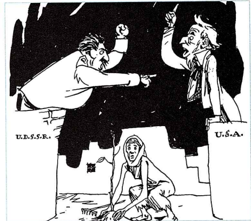
M2: Europa zwischen den Fronten im Ost-West-Konflikt (Karikatur, 1947)

Im Jahr 1955 entstand der Warschauer Pakt (WP) als östliches Militärbündnis. Von nun standen sich beide Blöcke in Europa und der Welt feindlich gegenüber. Sie gaben gewaltige Summen für die Aufrüstung ihrer Streitkräfte aus.